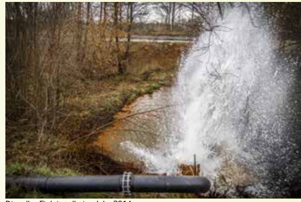
Dieselbe Einleitstelle im Jahr 2014

Genau auf der anderen Seite - gut versteckt im Wald - wird das verockerte Wasser in die Landschaft entlassen, und fließt dann in das Naturschutzgebiet „Koselmühlenfließ“