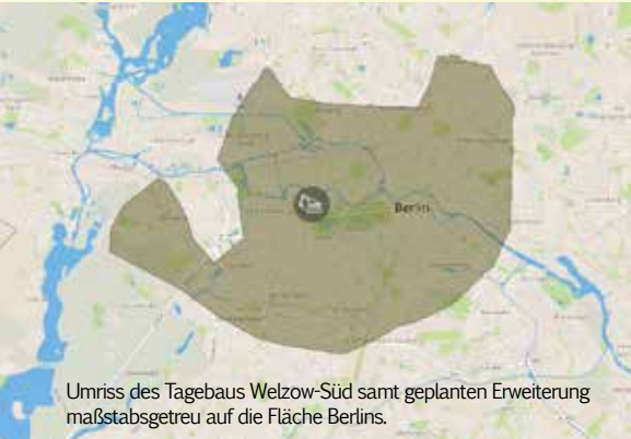
Umriss des Tagebaus Welzow-Süd samt geplanten Erweiterung maßstabsgetreu auf die Fläche Berlins.

Wir freuen uns, dass sie unserer Einladung zu einem Besuch vom Dezember 2014 nachgekommen sind und sich unsere Region ansehen wollen.