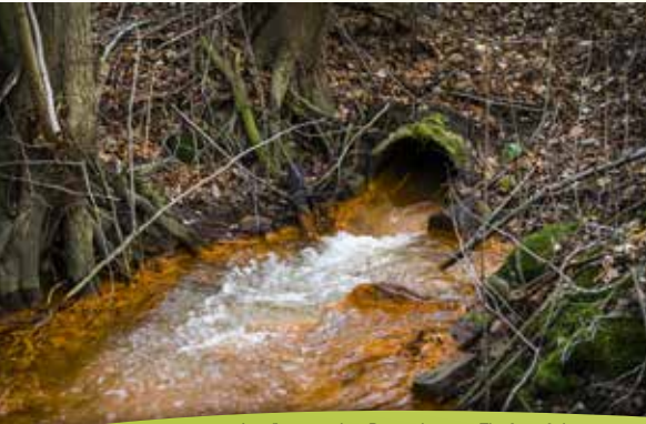
Ausfluss in das Petershainer Fließ auf der anderen Straßenseite im Juni 2015

Tipp: Fragen sie ob, sie aussteigen können. An der abbiegenden Straße nach Neupetershain befindet sich ein kleiner Feldweg. Gehen sie dann in das Waldstück auf der anderen Straßenseite. Sollte dies nicht möglich sein, nur etwa 2 Kilometer entfernt gibt es einen großen Busparkplatz in Steinitz. Dort kann man in etwa 5 Minuten Fußweg zu den Einleitstellen „Steinitz“ kommen.